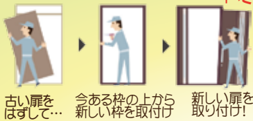
古い扉をはずして... 今ある枠の上から新しい枠を取付け 新しい扉を取り付け!